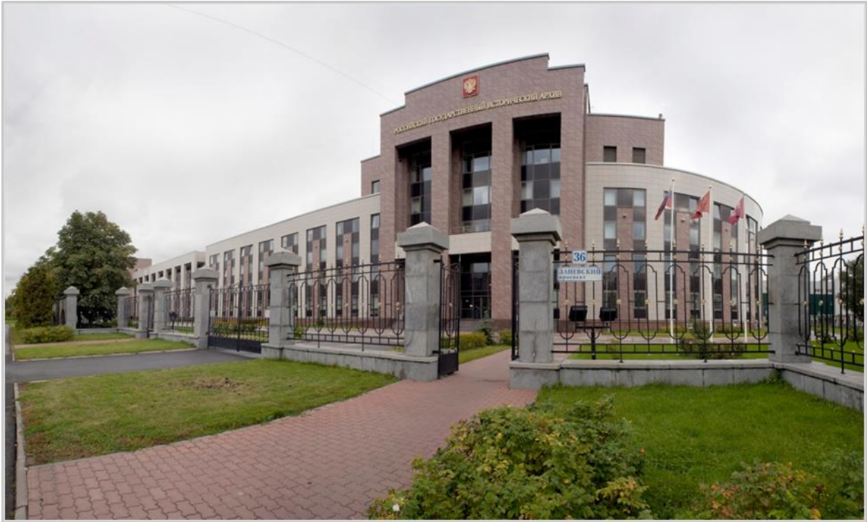
Российский государственный исторический архив Санкт-Петербург, Заневский пр., 36